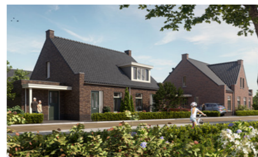
Bloknummer 17 Bouwnummer 23, 24, 25 & 26