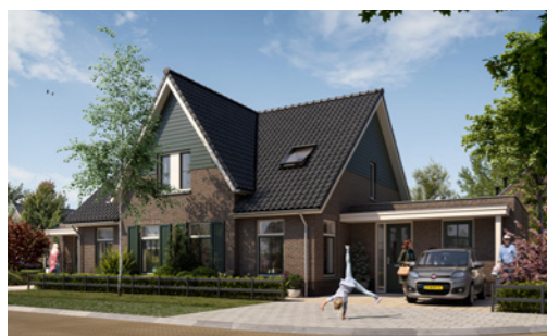
Bloknummer 16 Bouwnummer 21 & 22