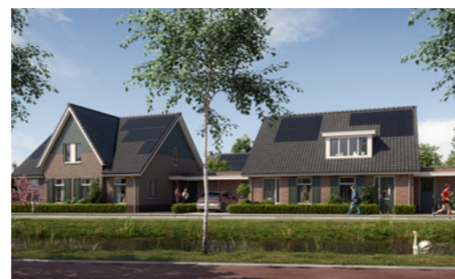
Bloknummer 18 Bouwnummer 27, 28, 29 & 30

De verkoopprijzen zijn inclusief 21% omzetbelasting en V.O.N.